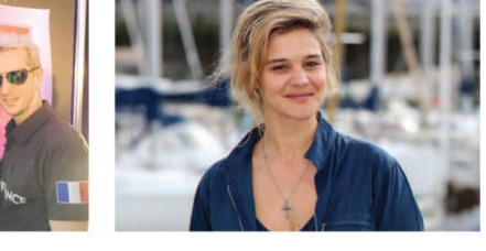
Communauté de 6 personnes partageant la passion du yoga