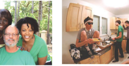
Famille nucléaire avec 3 enfants jeunes adultes. Artisans.