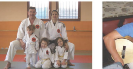
Père célibataire avec enfant, tra- vail à domicile.