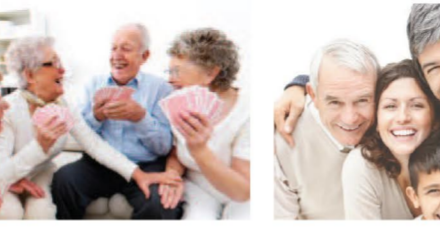
Un homme seul.