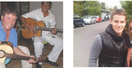
Colocation 2 couples per- sonnes agées,