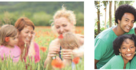
Deux femmes célibataires avec enfants