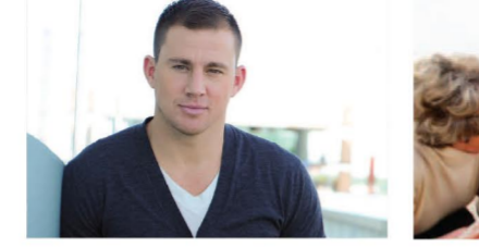
Troupe 3 femmes.