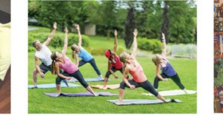
Deux frères musiciens.