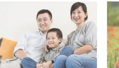
Famille nucléaire avec enfant