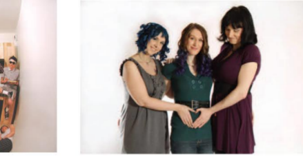
Colocation 5 jeunes adultes